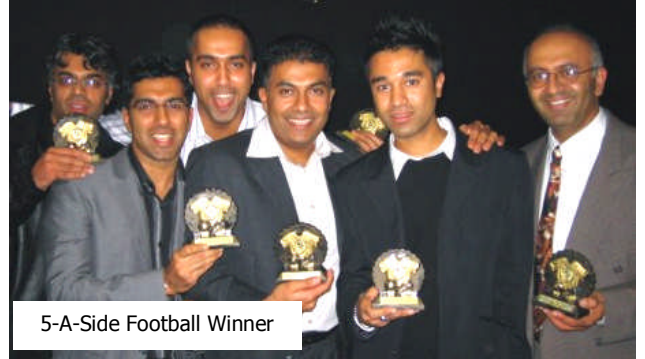
5-A-Side Football Winner

There was plenty to drink, and for snacks Chilli Paneer and Samosas were made available.