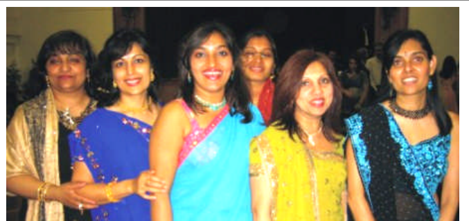
Diwali / New Years Party